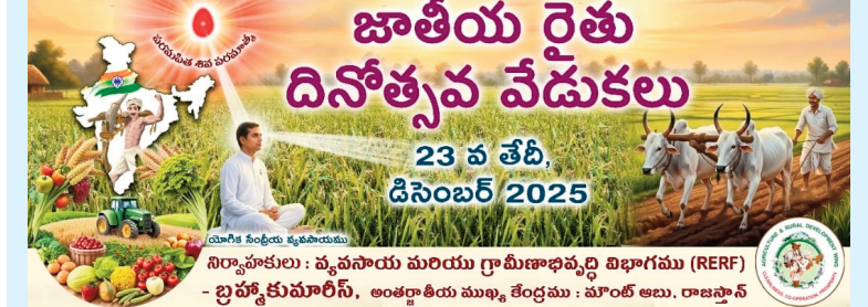
కార్యక్రమ వేదిక : నిర్మాతల సేవ కేంద్రము :